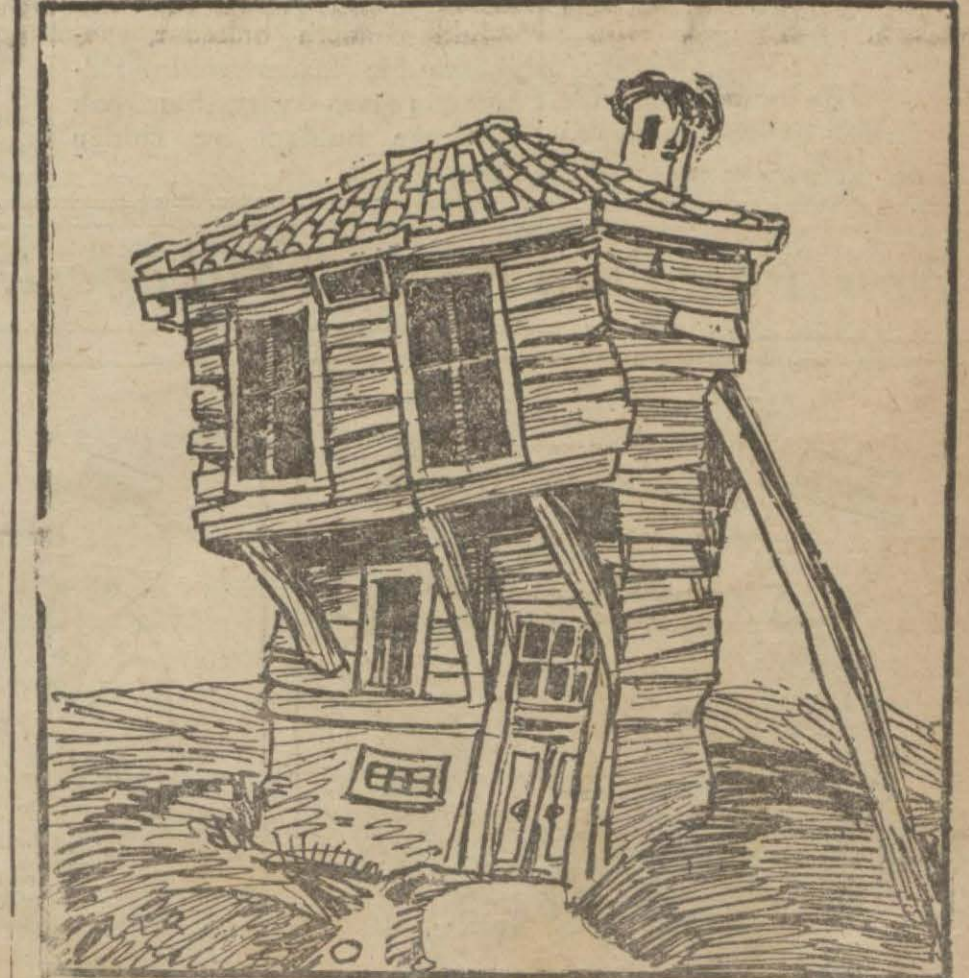
Viran ev — Apartımanlar dile geliyormuş. Ah, bir de ben dile gelsem de fakir ahalinin benim çatılarım altında neler çektiğini anlatsam!