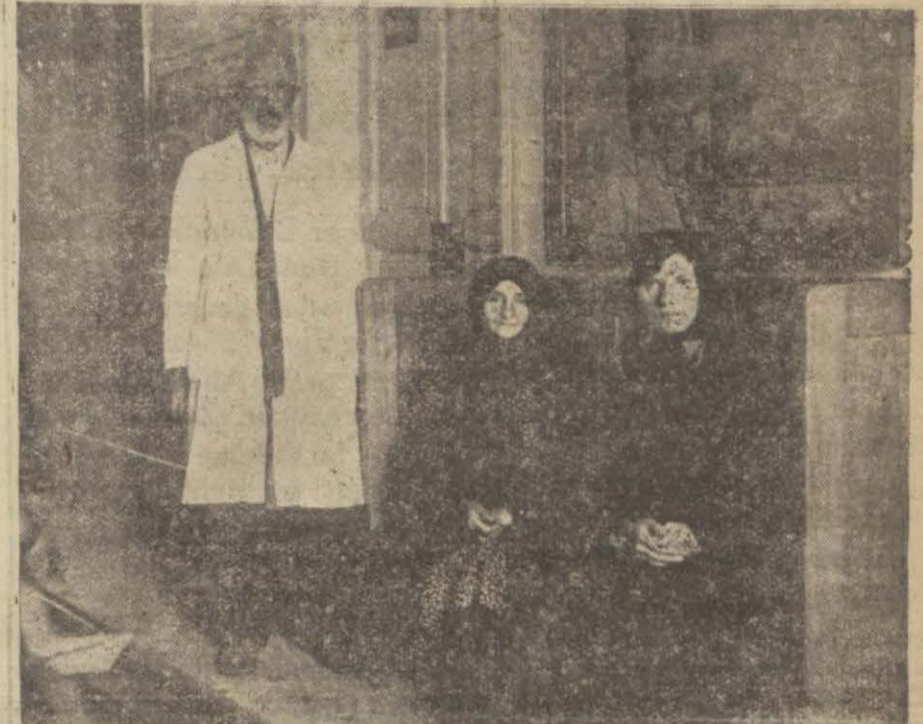
Dispanserde şifo döktüğü çığır hasıraları